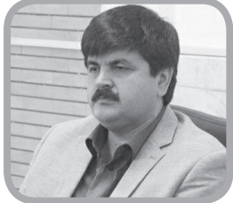
احمد یزدان‌پناه اقتصاددان