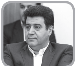
حسین سلاجورزی رئیس‌جمهور سابق ایران